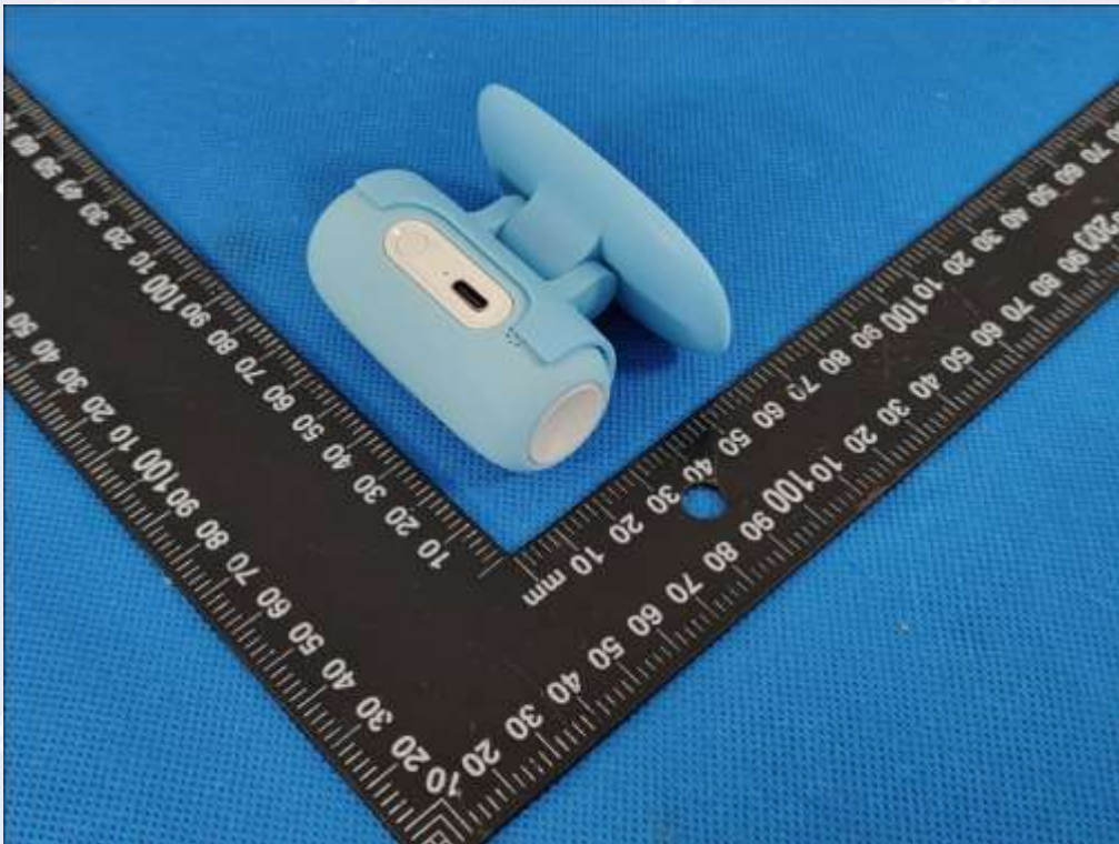
图 2 产品照片