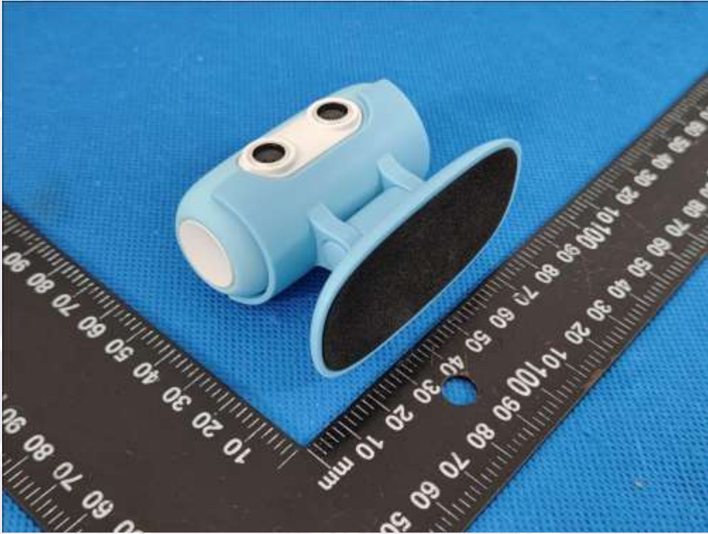
图 1 产品照片