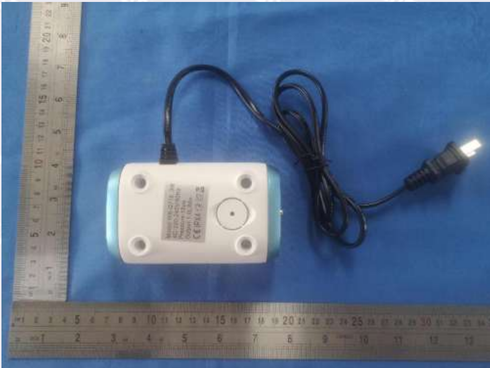
图 2 背面照片