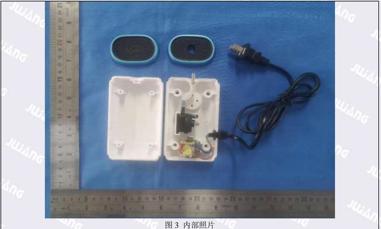
图 3 内部照片