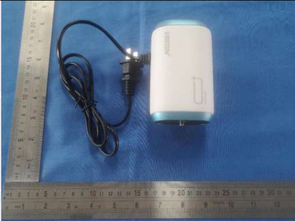
图 1 正面照片