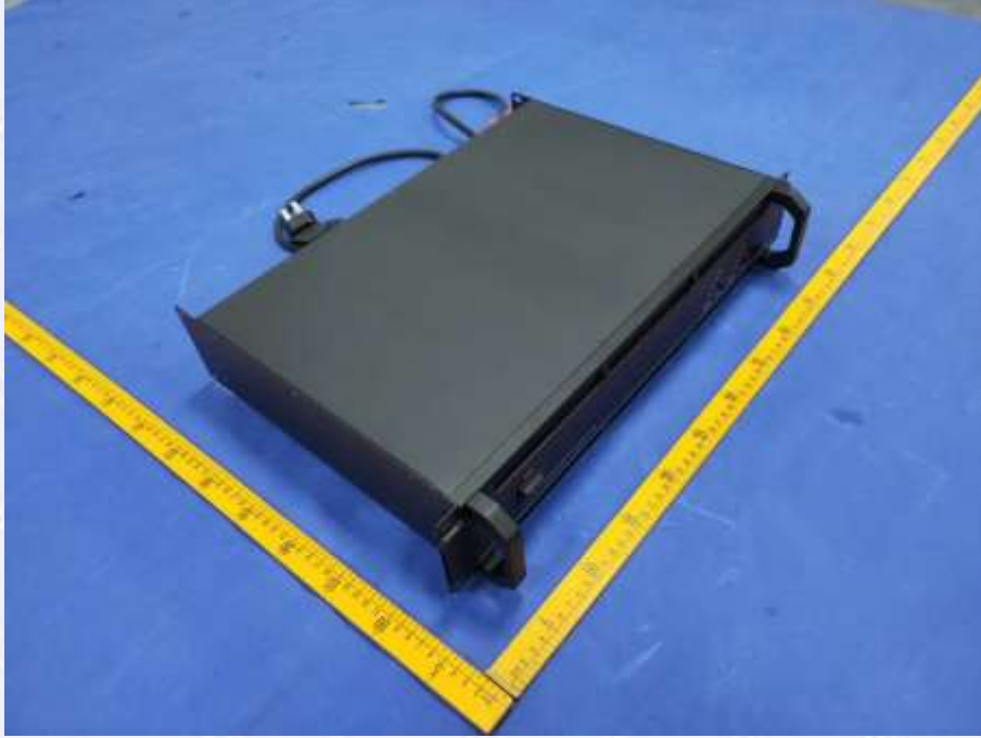
图 1 外观照片