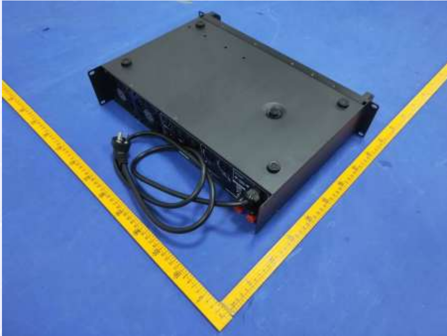
图 2 外观照片