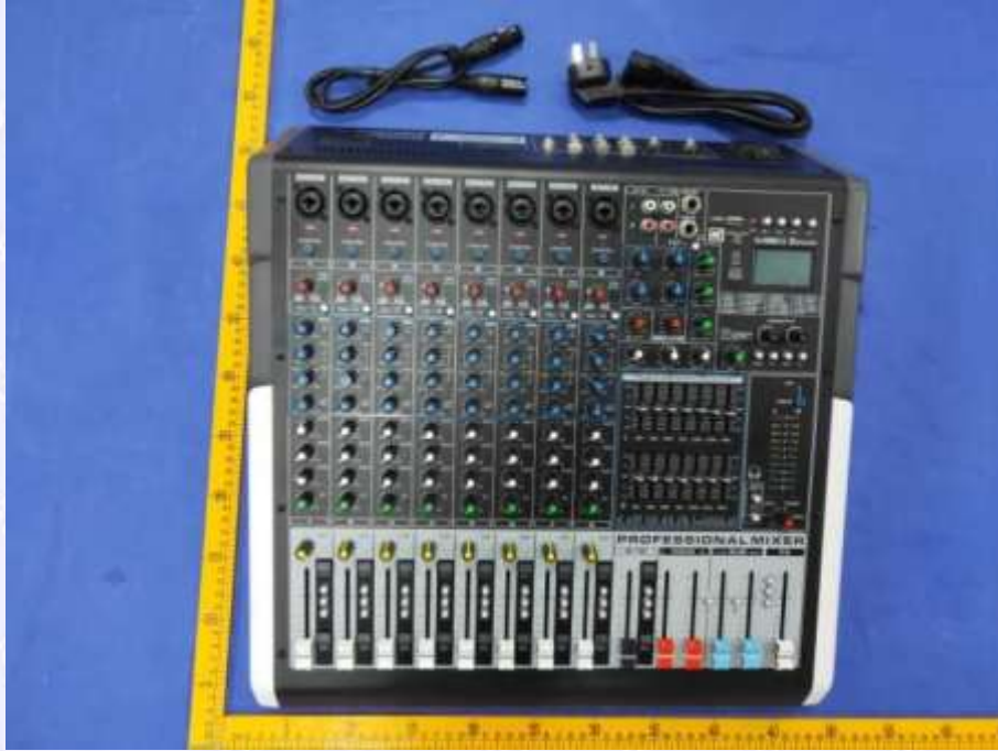
图 1 外观照片