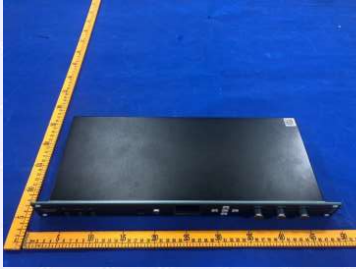
图 1 外观照片