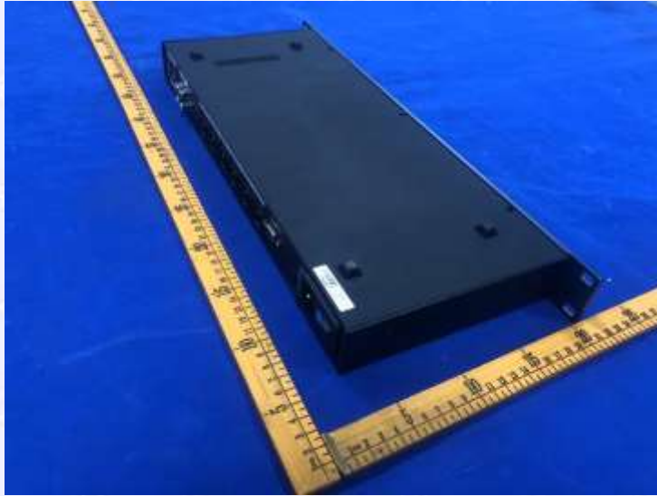
图 3 外观照片