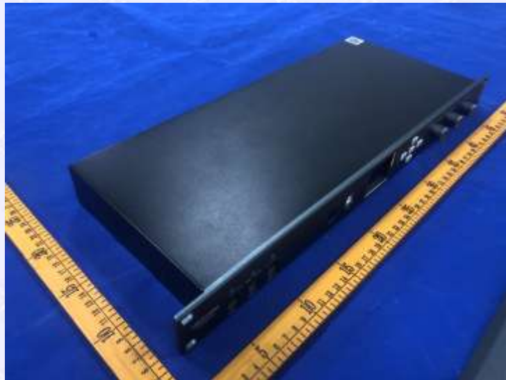
图 2 外观照片