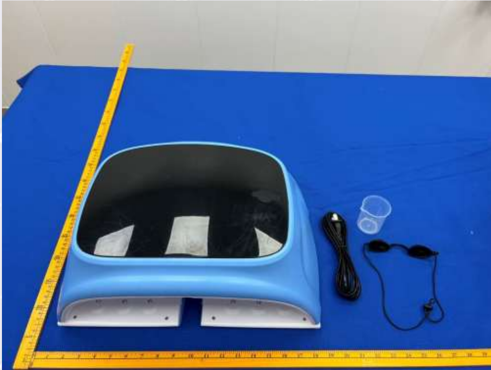
图 1 正面照片