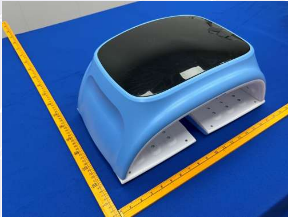
图 4 侧面照片