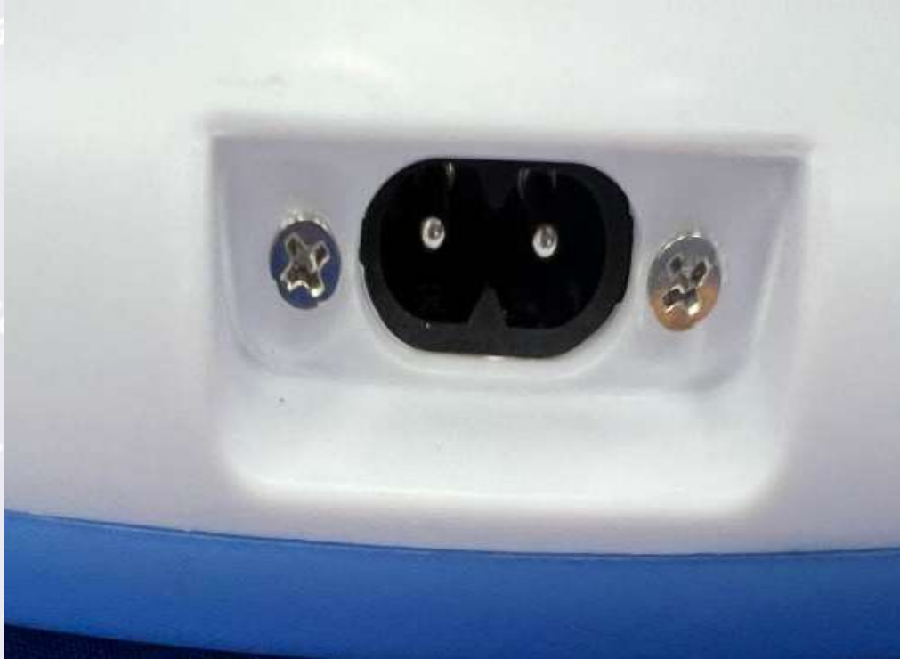
图 3 电源接口照片